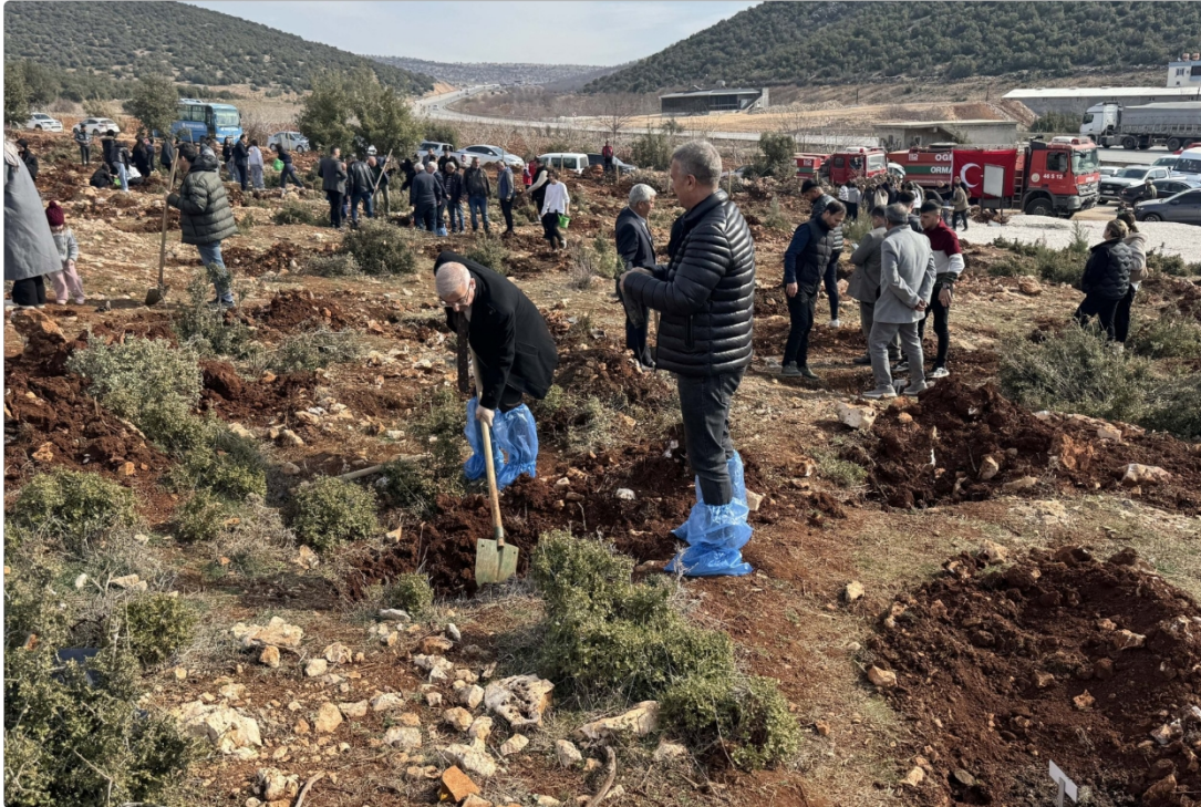
6 Şubat 2023'te Kahramanmaraş'ın Pazarcık ilçesinde meydana gelen depremde hayatını kaybedenlerin anısına dikilen 420 fidan, 4 Şubat 2025.

TARAFINDAN DAILY SABAH WITH AA FEB 16 , 2025 1 : 59 PM